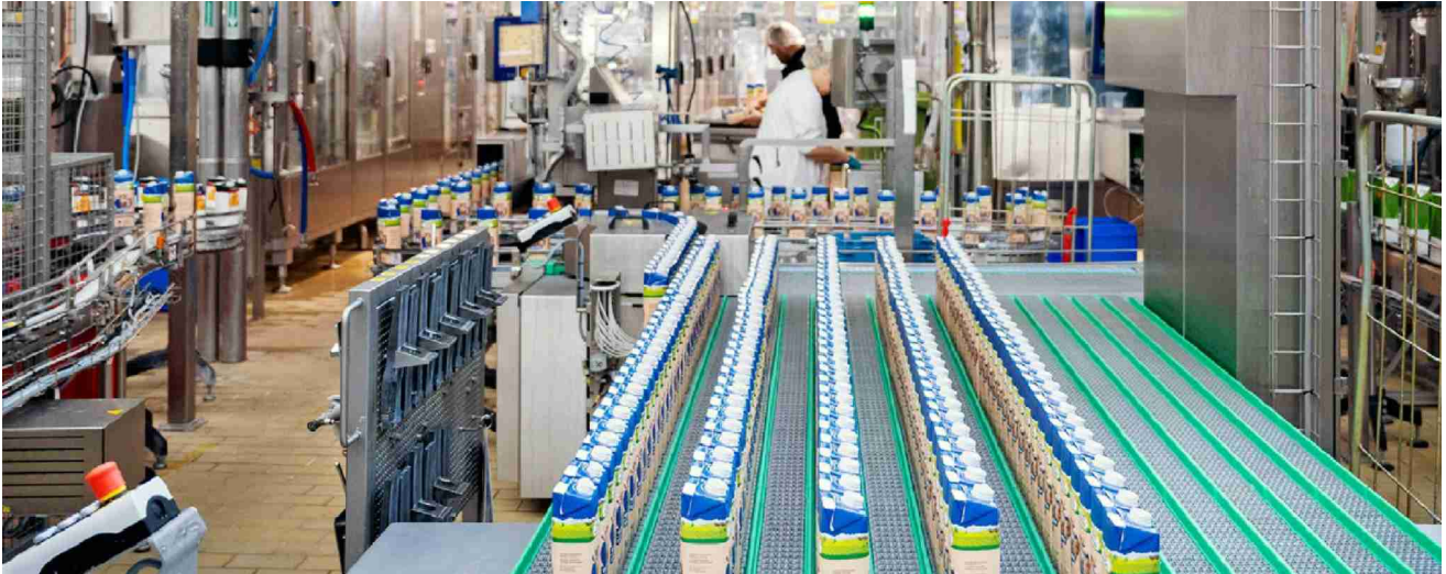
Molkerei von Emmi in Suhr AG: Grosse Unterschiede beim Nährstoffgehalt von Vollmilch

Vollmilch in Bio-Qualität enthält meist gesunde Fette, Vitamine und Mineralstoffe. Das zeigt der K-Tipp-Test. Dies gilt sowohl für Bio-Milch vom Discounter als auch für Produkte mit der Knospe. Nur eine Bio-Milch der Migros fiel ab.